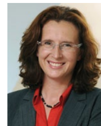
GISELA STANG ist Bürgermeisterin von Hofheim/Taunus und stellvertretende Vorsitzende der SPD-Hessen

Mit dieser Intention wurde die Moderationsmethode World Café entwickelt: Bunt gemischte Gruppen sitzen an kleinen Tischen zusammen und tauschen sich angeregt zu einem gemeinsamen Thema aus. Der Diskussionsprozess wird mit tiefer gehenden Fragen begleitet, die Tischgruppen werden zwischendurch aufgelöst und wieder neu zusammengesetzt. Dadurch vernetzen sich die Gedanken der Teilnehmenden, erweitern sich und entwickeln Ergebnisse.